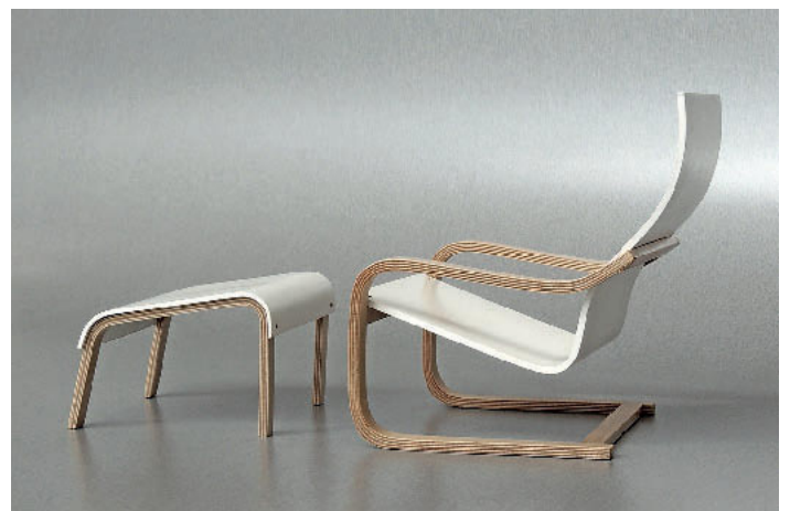
/ Erst gut 40 Jahre alt: Den Sessel Poäng von Ikea hat Halil Hinz als Miniatur mit einer Sitzfläche aus Formsperrholz variiert und um einen Hocker ergänzt.

fläche geschliffen werden. Gleich dem Original gibt es auch die Miniaturen in den Farben Rot und Schwarz.