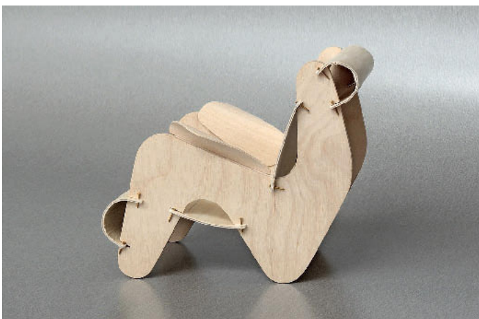
/ Aus der Fläche in den Raum: ein gesteckter Stuhl aus dünnem Birkenspertholz nach einem nie in Serie gegangenen Entwurf von Rietveld aus den 30er-Jahren.