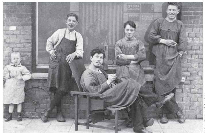
/ Der Tischlermeister Gerrit Rietveld umgeben von seinen Mitarbeitern auf einem noch nicht farbigen Prototyp seines berühmten Rot-Blau-Stuhles von 1918.

Stuhlklassiker von Thonet bis Marc Newson im Original sehen. Schon immer an Design und Architektur interessiert, hatten es ihm die fein detaillierten Modelle schon zu Beginn der 90er-Jahre angetan und er beschloss, sich an die ersten eigenen Stuhlminiaturen zu wagen.